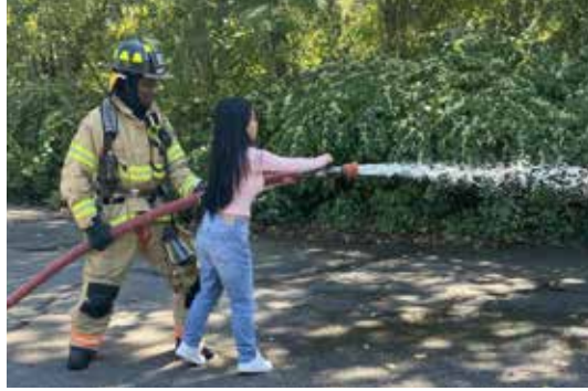
طلاب مدرسة نيو بريتن الثانوية يستكشفون الفرص الوظيفية مع إدارة الإطفاء في نيو بريتن

ما الجديد وماذا يحدث في مدارس منطقة نيو بريتن الموحدة؟