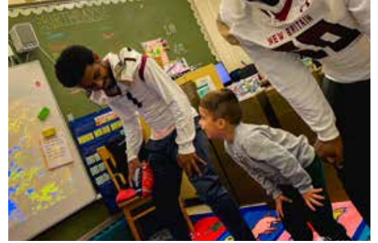
افتتاح أكاديمية ليتل كينز Little Canes للصغار في مدرسة نيو بريتن الثانوية