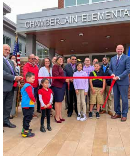
قص شريط مدرسة تشامبرلين الابتدائية

نشكر كل من انضم إلينا الشهر الماضي في مدرسة تشامبرلين الابتدائية في حفل قطع الشريط والتدشين الرسمي للمبنى الجديد.