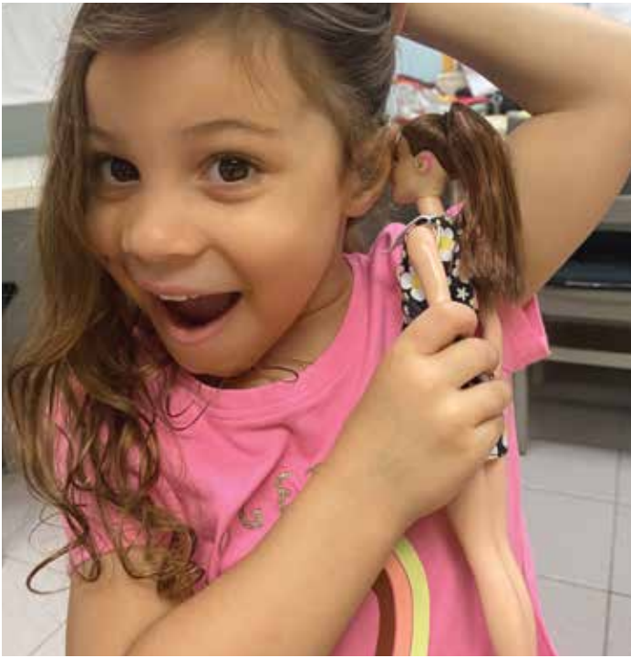
طالبة من مدرسة تشامبرلين تلعب بدمية باربي مزودة بوسائل مساعدة للسمع، وهي جزء من سلسلة دمي "Fashionista" الجديدة من شركة Mattel المصممة للأطفال "ليروا انعكاس أنفسهم".

بيئة مدرسية عادية ولا يتم تمييزه". إنه متحفز ويريد تعلم المزيد وأشعر أن إدراجه في برنامج تشامبرلين قد منحه الفرصة للقيام بذلك. إنه يعلم أنه ليس الطفل الوحيد الذي يرتدي غرسات القوقعة الصناعية وأن هذا أمر طبيعي".